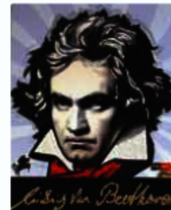
Ludwig van Beethoven aus 5000 gesplitteten Lasagne-Nudeln

” Aus verschiedenen Nudelsorten, Gewürzen und Hülsenfrüchten entstand so wunderschöne EAT ART